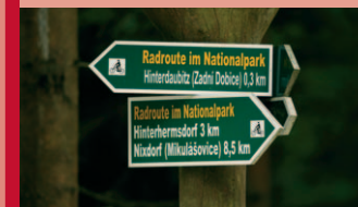
Značení cyklotras v NP Saské Švýcarsko