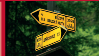
Značení cyklotras v NP České Švýcarsko