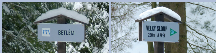
Označení ledopádů a přístupových cest v terénu (značení Správy NP)