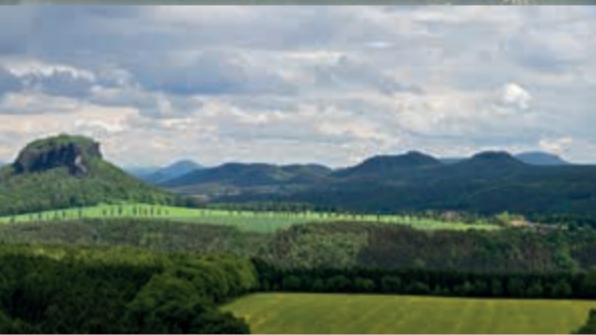
Skalní plošiny a stolové hory

Skalní plošiny jsou díky propustnému pískovcovému podloží velmi suché. Pouze ojediněle vznikla v místech s nepropustným podložím maloplošná rašeliniště s unikátní flórou i faunou. Většinu plošin ale původně porůstaly tzv. borové doubravy, které však lidé v minulosti vykáceli a nahradili stejnověkými porosty borovice lesní, smrku či modřinu. Cílem obou národních parků je vrátit do těchto míst opět přírodě blízký smíšený les.