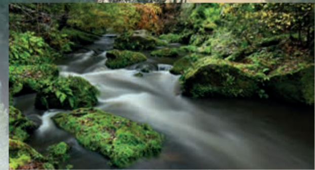
Rokle a soutěsky

Malé i větší vodní toky se neustále zahlubují do měkkých pískovců a vytvářejí labyrint roklí a soutěsek Českosaského Švýcarska. Zatímco vysoko na skalách je teplo a slunečno, panuje v roklích přítmí, vlhko a chlad. Díky tomu zde mohou i ve velmi nízkých nadmořských výškách žít podhorské a horské druhy rostlin.