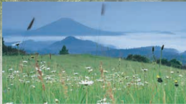
Vrcholy sopečného původu

Čedičové a znělcové vrcholy ozvláštňují pískovcovou krajinu Českosaského Švýcarska. Vznikly rozpadem ztuhlého magmatu přírodních kanálů třetihorních sopek, které si prorazily cestu pískovcovým podložím. Díky odolnosti sopečných hornin tvoří v krajině nápadné dominanty, mj. i nejvyšší vrcholy obou národních parků.