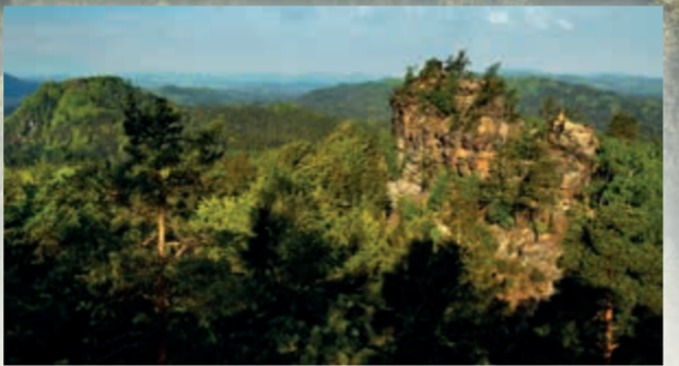
Skalní věže a stěny

Bizarní pískovcové věže a stěny tvoří romantické kulisy zdejší krajiny. Málokde najdeme na tak malém prostoru tak pestrou mozaiku tvarů zemského povrchu jako zde. Rozpukané pískovcové bloky, skalní brány a okna, kolmé stěny, rozbrázděné vrcholky skal, skalní římsy a voštiny, to vše dává krajině Českosaského Švýcarska neopakovatelné kouzlo.