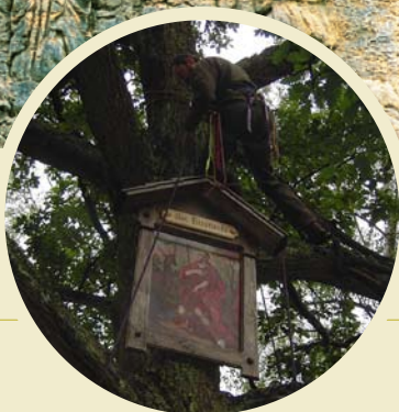
Instalace obrazu sv. Eustacha u lovecké chaty na Jedlině Na Tokání

všechny obnovy. Ani tato nařízení nedokázala ochránit všechny památky, a tak hodně záleželo na diplomatickém umění konkrétního faráře. Přesto řada objektů získala své patrony a jejich rodiny se o kříže a sochy staraly až do roku 1945. Po konci 2. světové války a odsunu obyvatelstva se péče vrátila zpět do starých kolejí, spoléhající jen na soucit a ochotu dobrovolníků.