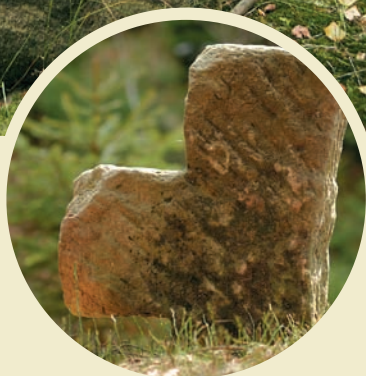
Stübelhannesův kříž u Studeného

podobě pronajatých ploch tzv. räumichtů od vrchnosti až například k označení úseku břehů s právem rybolovu. K nejstarším a nejuvýpravnějším památkám tohoto druhu patří zemský hraničník u Zadních Jetřichovic - vysekaný reliéf erbu Vartenberků ze 16. století.