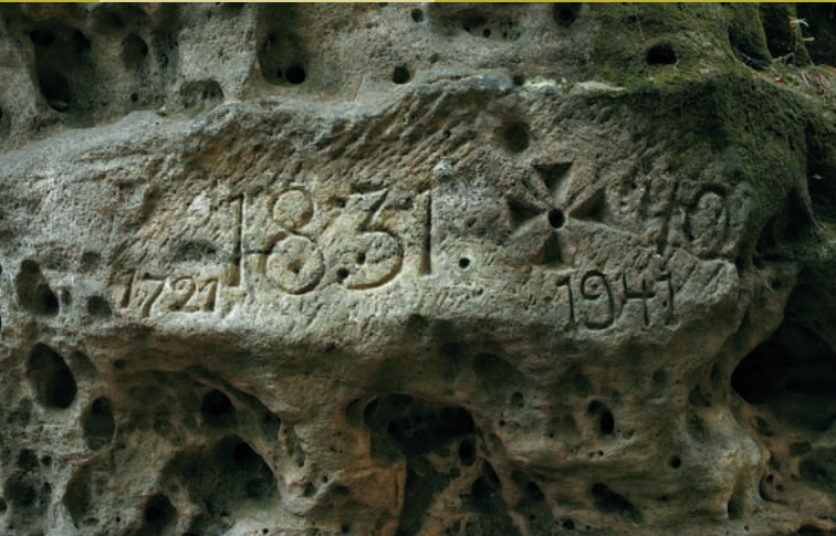
Hraniční značky na Semmelsteinu u České silnice