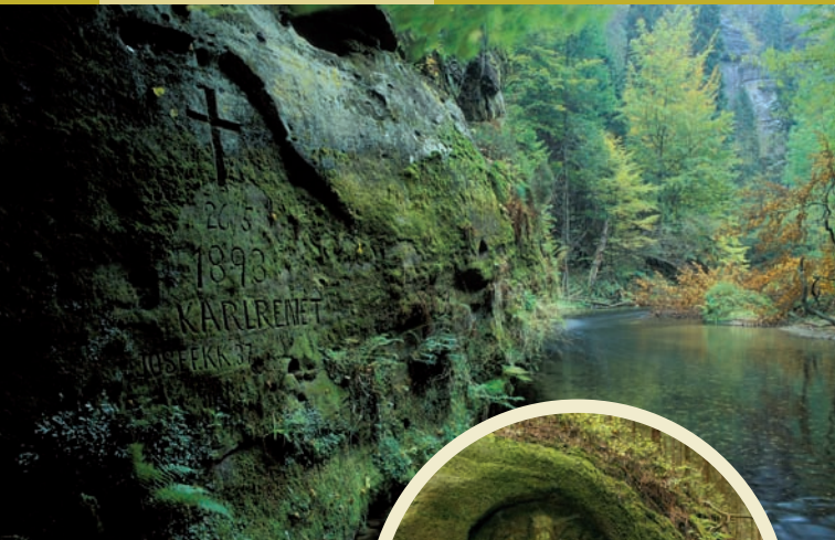
Renetův kříž u Vysoké Lípy

Stormův pomníček z r. 1855 u Jetřichovic