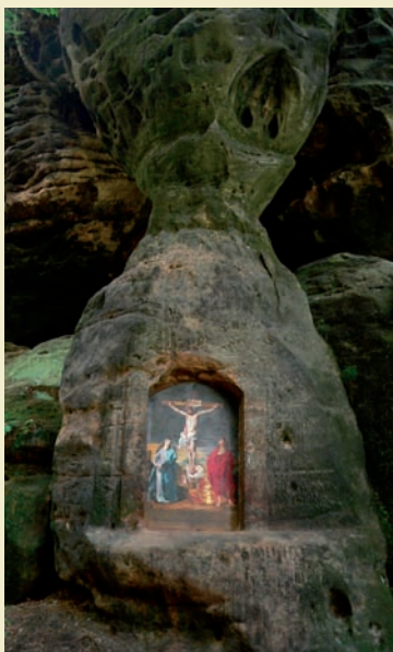
Výklenková kaple Kalvárie v Jetřichovicích

obrázky ve skále (např. obraz Ecce homo na cestě z Rynartic do Pavlinina údolí) tak i výklenkové kaple (za mnohé např. Knyovu kapli Posledního soudu u Jetřichovic či Weidlichovu kapli Nejsvětější Trojice a kapli Zmrtvýchvstání Krista Na Potokách u Rynartic). Nejprostornější z nich byla kaple sv. Ignáce z 1. třetiny 19. století ve Všemilech, která vznikla vysekáním místnosti uvnitř skalního bloku; kromě oltáře v ní bylo dostatek prostoru pro několik řad lavic.