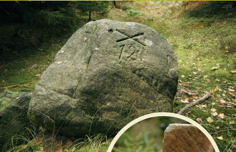
Mezník zv. Lagernummer