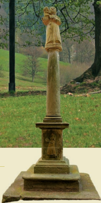
Sloup sv. Antonína u osady Kopec