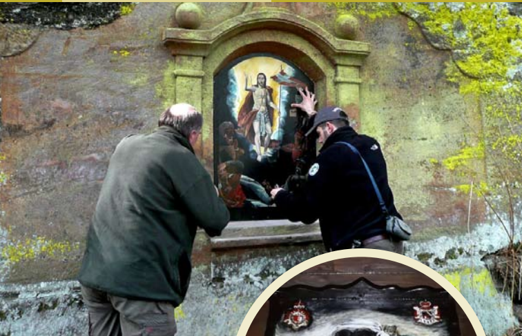
Kaple Vzkříšení Na Potokách, osazování nového obrazu