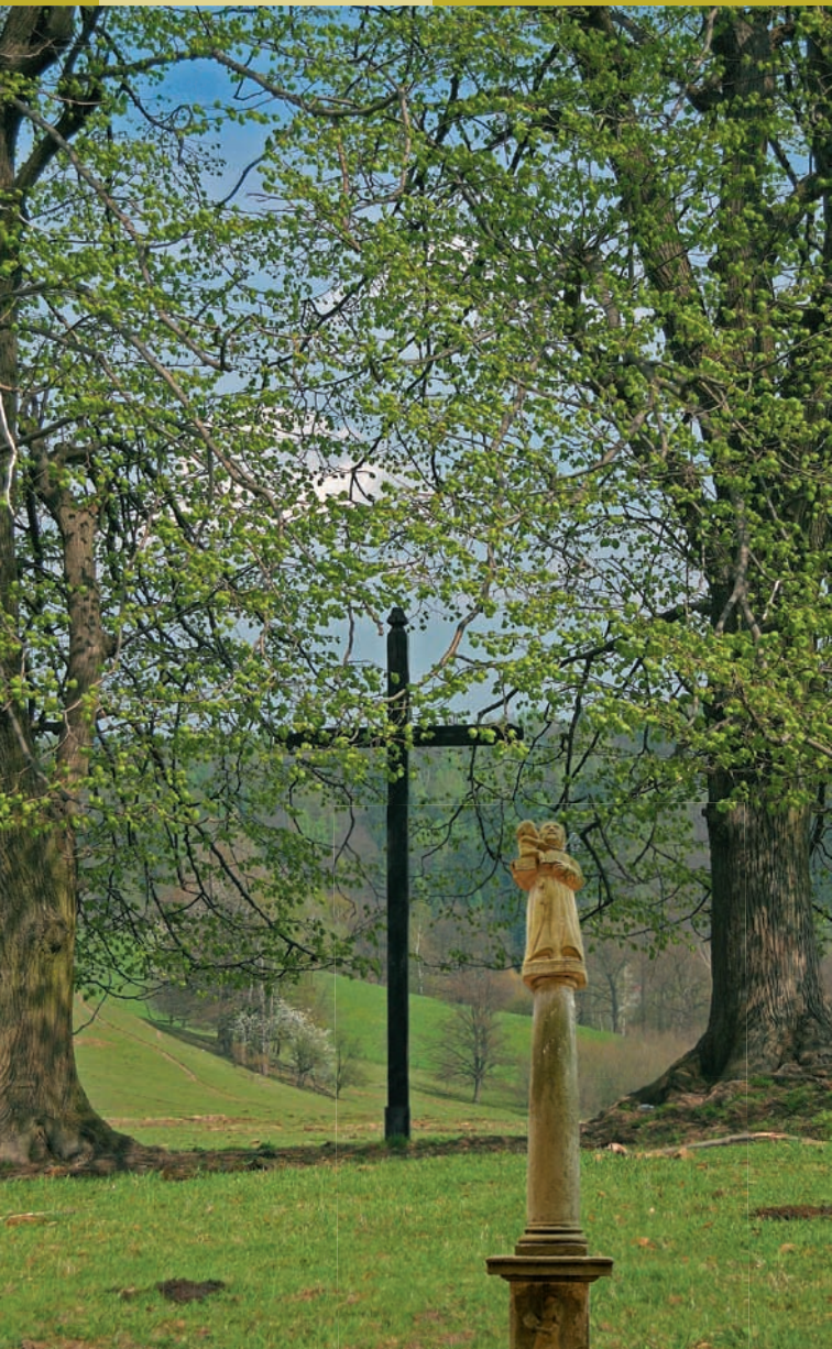
Klingebeckův kříž u Hel