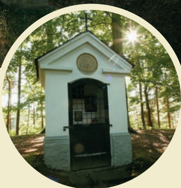
Kaple sv. Prokopa v Rynarticích