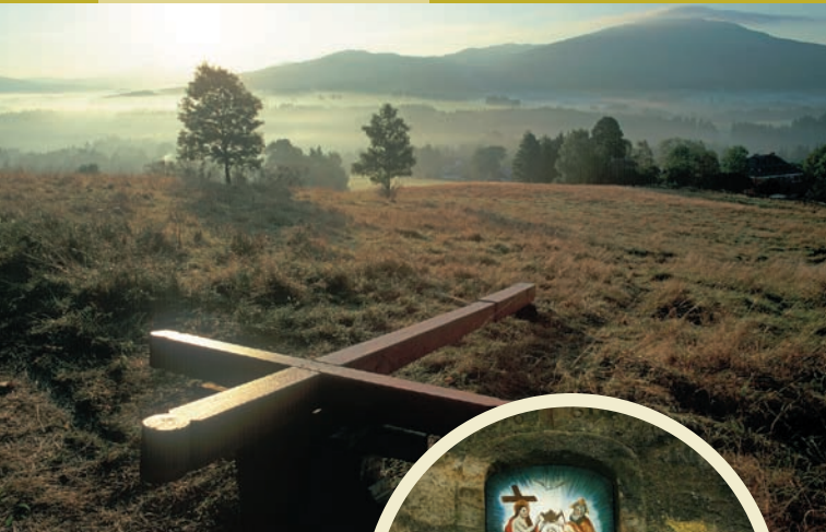
Kříž na Křížovém vrchu u Rynartic

Výklenková kaple Korunování Panny Marie, zv. Triefbartel u České silnice mezi Vysokou Lípou a Zadními Jetřichovicemi