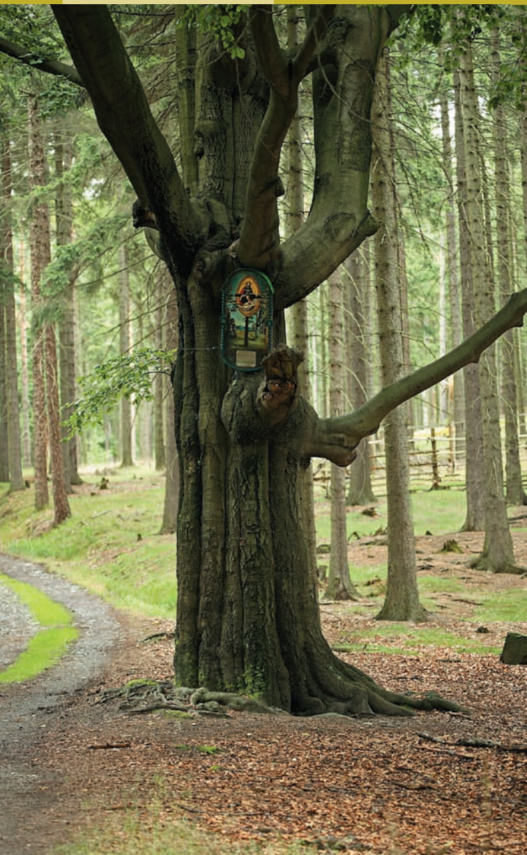
Obraz Nejsvětější Trojice na Třípackovém buku u Doubice