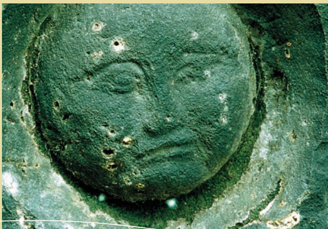
Reliéf luny, pravděpodobně ze 16. stol., Tetřeví stěny u Hřenska