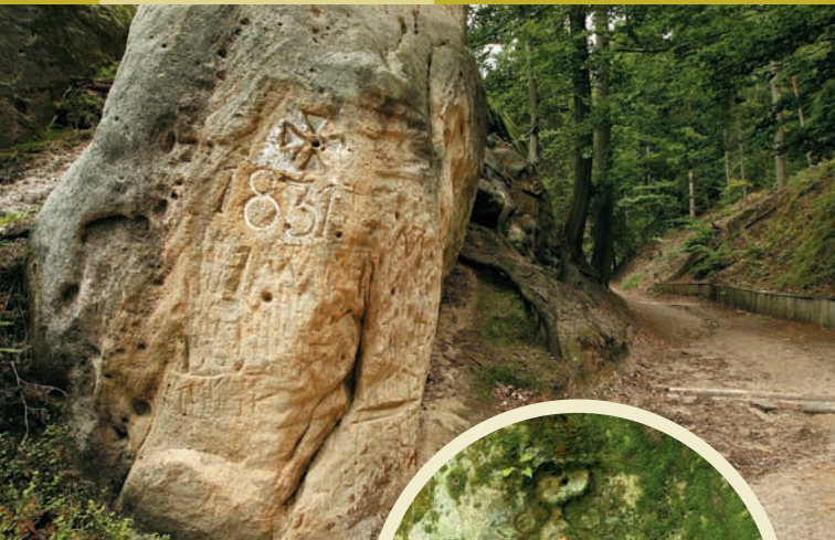
Mezník stabilního katastru, 1831, Jetřichovice