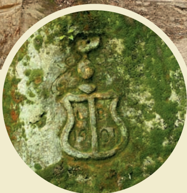
Erb rodu Vartemberků ze 16. stol., Zadní Jetřichovice