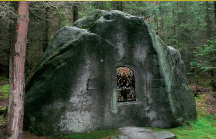
Knyova kaple Posledního soudu u Jetřichovic

obrázky ve skále (např. obraz Ecce homo na cestě z Rynartic do Pavlinina údolí) tak i výklenkové kaple (za mnohé např. Knyovu kapli Posledního soudu u Jetřichovic či Weidlichovu kapli Nejsvětější Trojice a kapli Zmrtvýchvstání Krista Na Potokách u Rynartic). Nejprostornější z nich byla kaple sv. Ignáce z 1. třetiny 19. století ve Všemilech, která vznikla vysekáním místnosti uvnitř skalního bloku; kromě oltáře v ní bylo dostatek prostoru pro několik řad lavic.