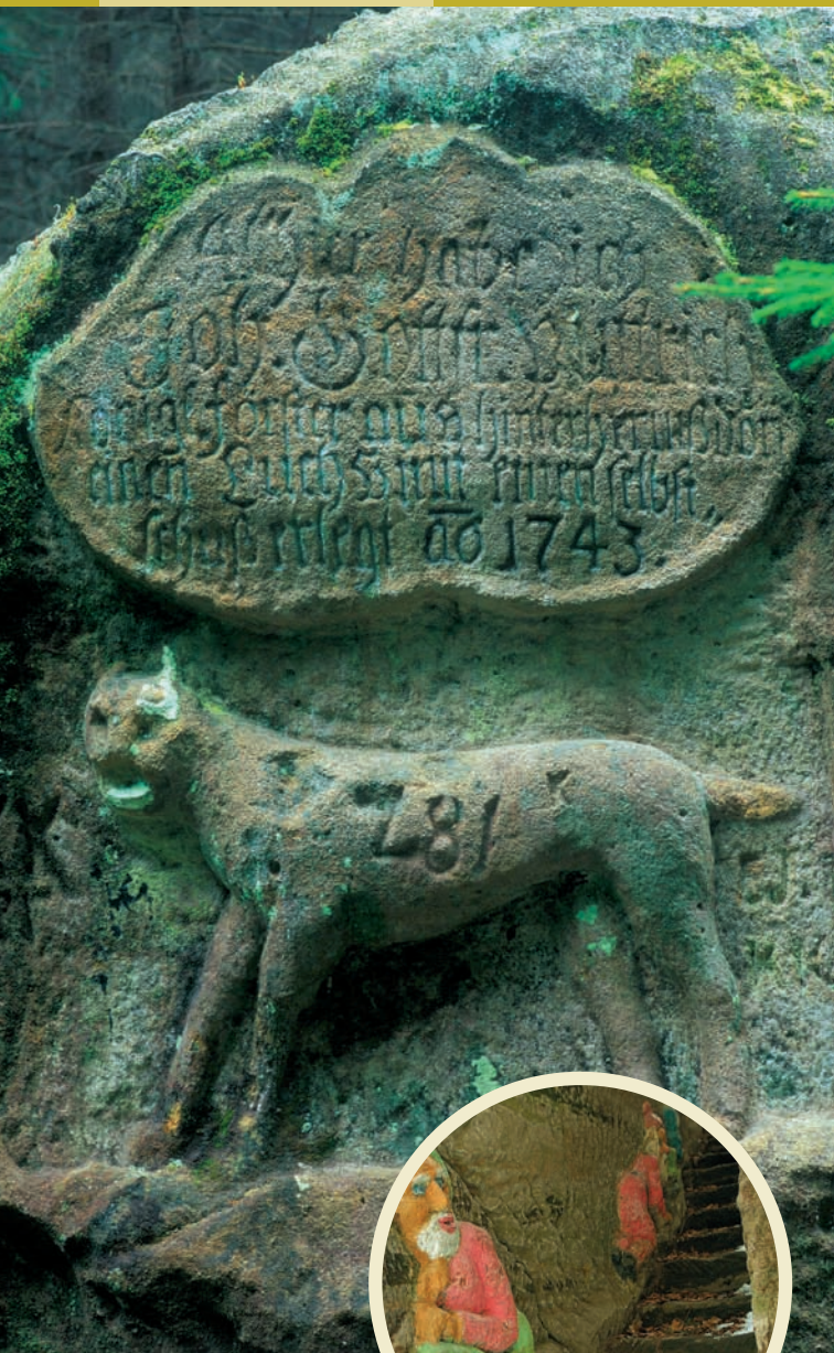
Rysí kámen ve Velkém kozím dole

Trpasličí skála u Rynartic Skalní reliéfy z 3. čtvrtiny 19. století zobrazující pověst o pomoci skřítků staré chudačce Ritschelové, zaklíněné po pádu do skalní trhliny.