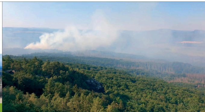
Jedna z prvních fotografií lesního požáru pořízená z vyhlídky Klippan v Sasku, zhruba v sedm hodin ráno.