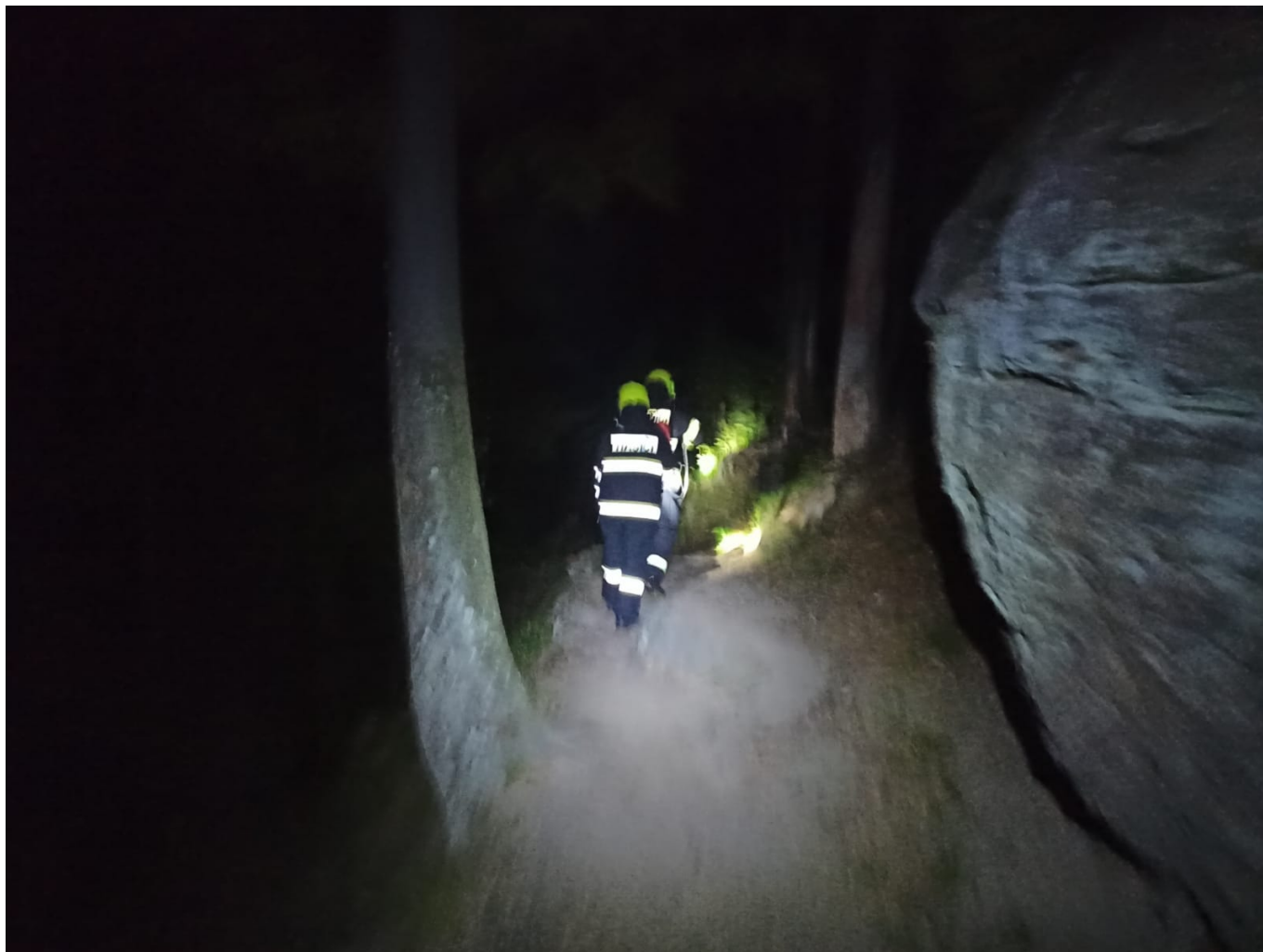
Ohniště bylo uhaženo s využitím zářivých vaků, nářoňnám terčím a ve tmě hasiči na vrchol Rudolfova kamene vynesli zhruba 100 litrů vody.