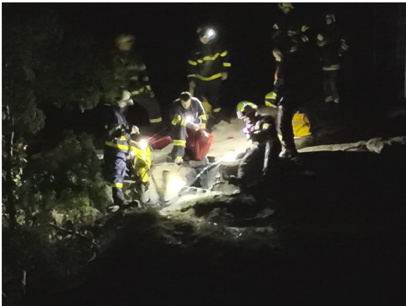
Hasiči likvidujã ohniã;ta na Rudolfovã kameni.