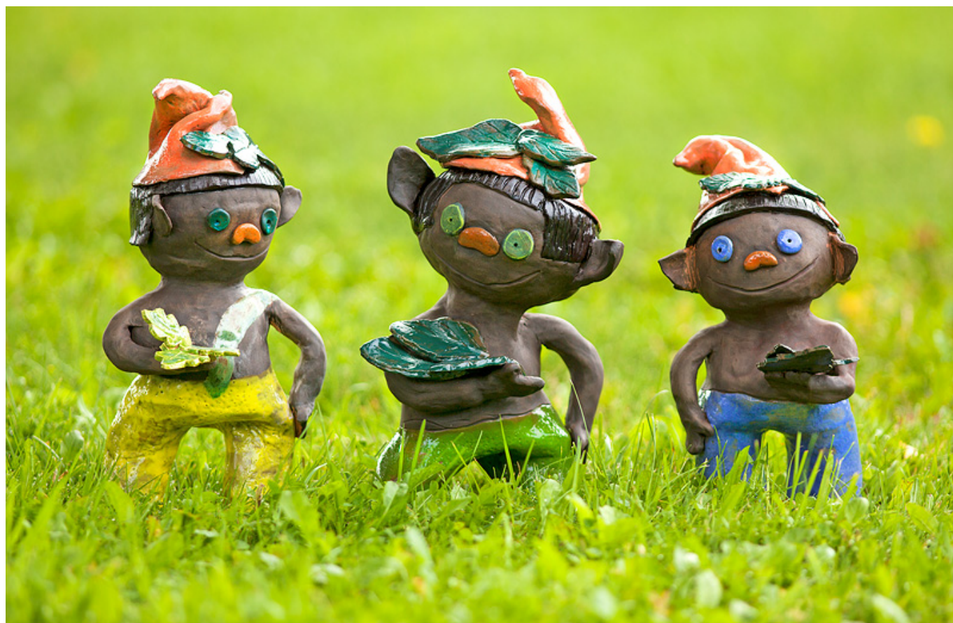
Obrázek: Stromový skřítek jako pohár pro tři nejlepší školy (1. místo - skřítek se zelenými kalhotkami, 2. místo - skřítek se žlutými kalhotkami, 3. místo - skřítek s modrými kalhotkami)

Pro rok 2011, který byl vyhlášen Mezinárodním rokem lesů, připravila Správa NP České Švýcarsko soutěžní projekt pro školy i mimoškolní organizace s názvem VRACÍME PRALES DO ČESKÉHO ŠVÝCARSKA . Školy z blízkého i vzdálenějšího okolí se do tohoto projektu zapojily vysazováním stromků a společnými silami dokázaly vysadit více než 10 tisíc sazenic. Společně s firmou O2 Telefónica a s účastníky česko-německého workcampu bylo v roce 2011 na území NP České Švýcarsko vysázeno více než 25 000 sazenic jeřabu ptačího. Trojice nejlepších škol, které se svými žáky vysadí nejvíce nových stromků, získají vítězný pohár a hodnotnou odměnu pro své žáky.