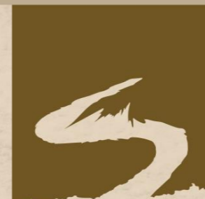
Naučná stezka Česká silnice

Vždy si přečtete celý odstavec, než začnete luštit. Odpovědi jsou většinou k nalezení na tabulích s logem naučné stezky nebo na vystavených exponátech. Odpověď hledejte na tabuli se stejným názvem, jako má označení otázky.