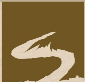
Naučná stezka Česká silnice