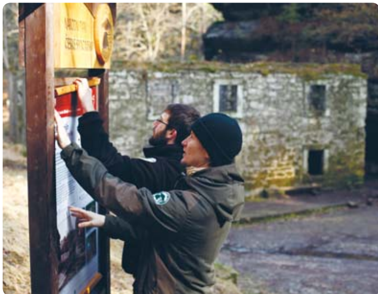
Instalace nového informačního panelu u Dolského mlýna