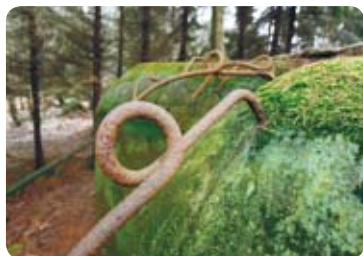
Oka k uchycení maskovací sítě

se dodnes dochovaly v horní části pevnůstky, sloužily k upevnění maskovací sítě.