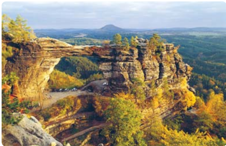
Pravčická brána a Růžovský vrch - dva symboly národního parku

Národní park České Švýcarsko byl vyhlášen v roce 2000 na ploše 80 km 2 v jádrové části Labských pískovců. Při státní hranici navazuje na Národní park Saské Švýcarsko. Rozsáhlé lesy, zachovalé vodní toky, monumentální skalní věže a hluboké soutěsky činí z Národního parku České Švýcarsko přírodní klenot severních Čech. Hlavním cílem péče o národní park je ochrana jedinečné přírody, která je na stále větší ploše ponechávána samovolnému vývoji, a přeměna nepůvodních jehličnatých