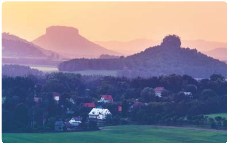
Pohled na Lilienstein a Zirkelstein z Pastevního vrchu

Dřevěná hláska tu zůstala i po konci druhé světové války. Do roku 1948 zde dokonce byla umístěna vojenská radarová jednotka.