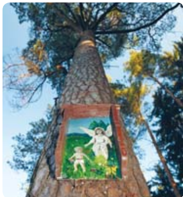
Borovice Anděla strážného

Příjemná a málo navštěvovaná cesta vás přivede na křižovatku lesních cest, kde vaši pozornost upoutá mohutná, více než třísetletá borovice. Tento nádherný strom je od roku 1998 chráněn státem. Podle motivu na vysvěceném obrázku zavěšeném na jeho kmeni je znám také pod jménem „borovice Anděla strážného“. Pohlad'te kmen staré sosny, přivřete na chvíli oči a zkuste se v myšlenkách vrátit o několik staletí zpět a prožít příběhy vážící se k tomuto místu.