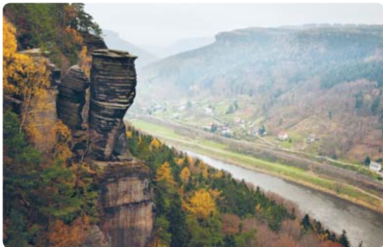
Kaňon Labe v chráněné krajinné oblasti

Chráněná krajinná oblast Labské pískovce byla vyhlášena v roce 1972 na ploše 330 km 2 . Po vyhlášení Národního parku České Švýcarsko se její plocha zmenšila na současných 250 km 2 . Na rozdíl od národního parku je hlavním posláním chráněné krajinné oblasti ochrana harmonické lesnaté a zemědělské krajiny, která je výsledkem více než pětisetletého soužití člověka se zdejší přírodou. Dodnes se zde dochovala řada cenných památek lidové architektury, unikátních technických děl, jakož