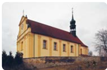
Kostel sv. Petra a Pavla

současná stavba pochází z let 1711 až 1715. V roce 1988 kostel zcela vyhořel. Po následné rekonstrukci byl znovu vysvěcen na podzim roku 2000 a dnes je duchovním i společenským centrem obce.