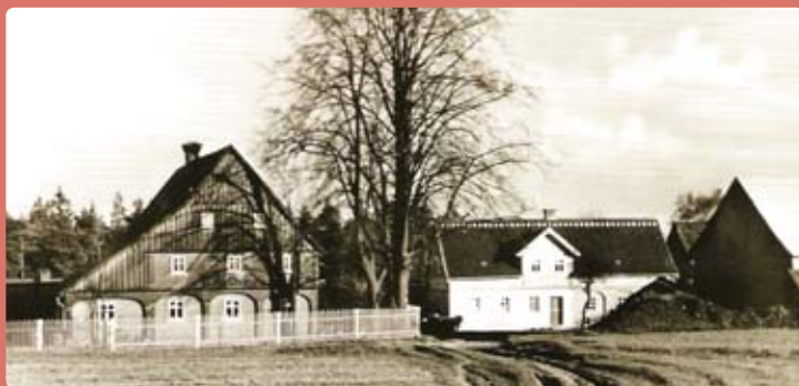
Kamenická Stráň v roce 1935