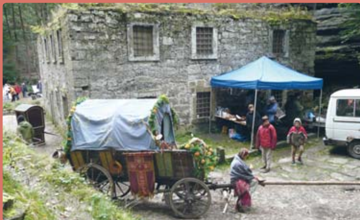
Natáčení pohádky Peklo s princeznou