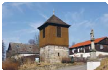
Historická zvonice u kostela

samostatně stojící zvonice u kostela je osazena třemi funkčními zvony (sv. Petra, sv. Pavla a sv. Barbory)