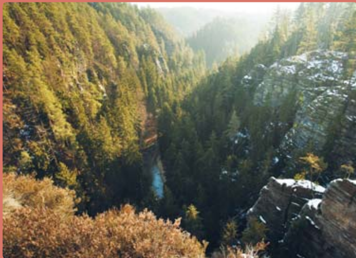
Pohled do soutěsky Kamenice

kovcové skály, odkud se před vámi otevře dech beroucí pohled do 80 metrů hluboké soutěsky říčky Kamenice. Díky odlehlosti vyhlídky máte velkou šanci, že si kouzlo tohoto místa budete moci vychutnat sami a v klidu.