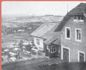
Hostinec s vyhlídkovou terasou

Hostinec jednou vyhořel, ale byl znovu postaven. Nevzpamatoval se až z událostí druhé světové války.