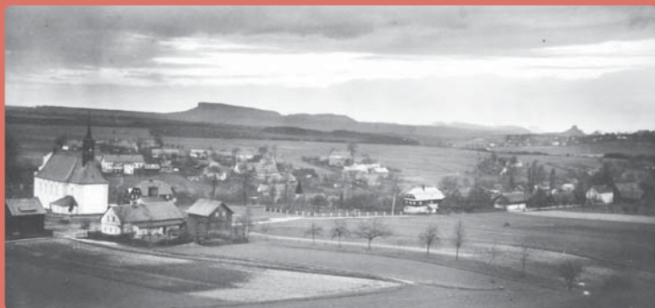
Obec Růžová (dobová fotografie)

Od úvodního panelu vede trasa po zpevněné cestě otevřenou krajinou nabízející pěkné výhledy do okolí. Během tohoto asi 800 metrů dlouhého rovinatého úseku upoutá vaši pozornost především impozantní silueta Růžovského vrchu. Pokochejte se chvíli pohledem na jeho zalesněné temeno, neboť záhy vstoupíte do přítmní lesa, které vás bude doprovázet téměř po celou další cestu po naučné stezce.