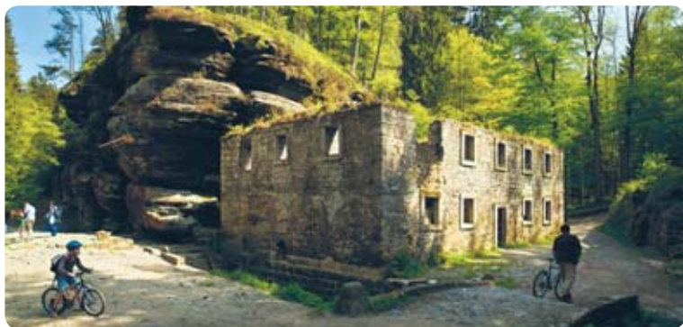
Dolský mlýn v současnosti

Původně se zde mlelo obilí pro obyvatele Vysoké Lípy, Růžové a Kamenické Stráně. V souvislosti s budováním nových mlýnů v okolí začal postupně význam Dolského mlýna upadat. K oživení došlo po zprovoznění pramíkové plavby ve Ferdinandově soutěsce v roce 1881 (viz foto), kdy zde prosperoval hotel a restaurace. Ukončení provozu pramic a druhá světová válka však znamenaly na dlouhou dobu konec zájmu o celou lokalitu.