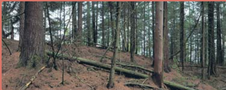
Vejmutovkový les bez bylinného podrostu