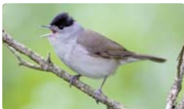
Pěnice černohlavá