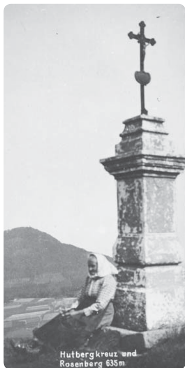
Kříž na Pastevním vrchu