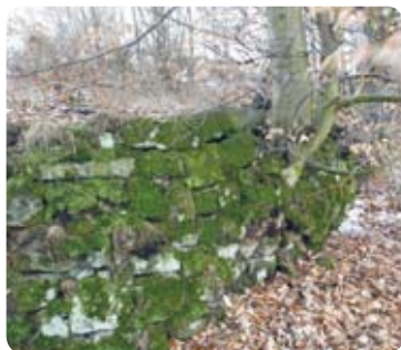
Torzo kamenné zidky

Předposlední zastavení naučné stezky vás zavede na severní svah Pastevního vrchu do míst, kde se kdysi rozkládala osada Nová Ves (Nová Víška, Neudorf, Neudörfel). Dnes zde naleznete již pouze zarůstající cesty a ruiny domů, několik studánek a pár chřadnoucích ovocných stromů. Novou Ves postihl osud řady vesnic v sudetském pohraničí, které zanikly po vysídlení původních obyvatel po roce 1945.