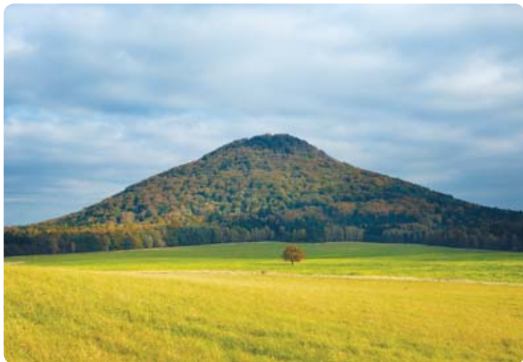
Krajinná dominanta Růžovský vrch

Nedaleko od místa druhého zastavení se nachází bývalý čedičový lom. Těžba stavebního kamene, který byl používán především při budování cest, bohužel v minulosti nenávratně zničila proslulou turistickou a přírodovědnou atrakci známou již v 19. století jako „ledové jámy“ („Eis Löcher“). Díky proudění vzduchu v rozsáhlém systému podzemních puklin tu na povrch vyvěral velmi studený vzduch, takže zde často zůstával až do léta ležet sníh.