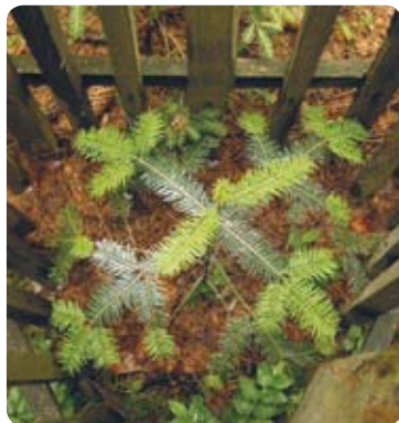
Sazenice jedle bělokoré

Po návratu z vyhlídky si nezapomeňte na informačním panelu přečíst pár řádků o historii zdejších lesů. V textu snad naleznete odpověď na otázku, proč se i po vzniku národního parku na jeho území kácí stromy. Ostatně četné důkazy o tom naleznete i v okolí tohoto zastavení. Lidé zde totiž v minulosti vysázeli nevhodné druhy dřevin, hlavně smrk, borovici vejmutovku nebo dub červený, které dnes správa národního parku nahrazuje původními druhy stromů, především bukem a jedlí.