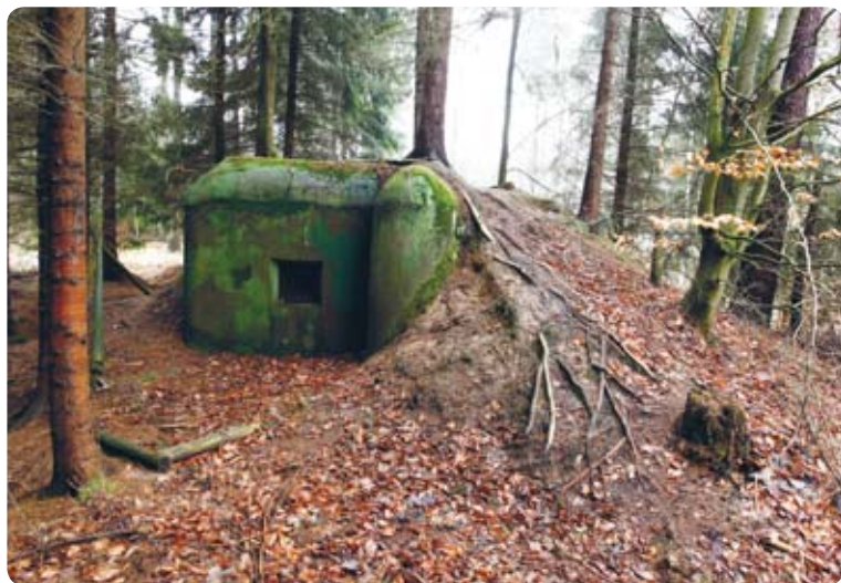
Němý svědek pohnuté historie

Úsek pohraničního opevnění od Dolského mlýna po Všemily střežila od jara roku 1938 rota č. 11/42, která posílila XXII. strážní prapor hájící obranné pásmo mezi Jetřichovicemi a Novou Hutí („Šěbrem“). Nepřátelské akce ze strany sudetoněmeckých organizací, manévry německé armády v blízkosti hranic a neustále se stupňující nátlak ze strany Německa činily službu u strážních praporů hájících obrannou linii státu psychicky i fyzicky velmi náročnou.