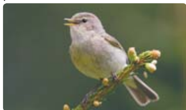
Budníček menší