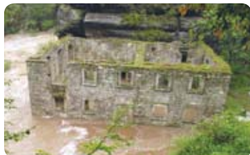
Srpnová povodeň v roce 2010

palírny. Budova někdejšího hotelu se proměnila v hromadu sutí zarůstající kopřivami. Až po převzetí areálu správou národního parku a s velkou pomocí dobrovolníků začal Dolský mlýn znovu ožívat. Snímek z povodně roku 2010 však dokládá, že tu lidské nadšení často vede nerovný souboj s rozmary přírody.