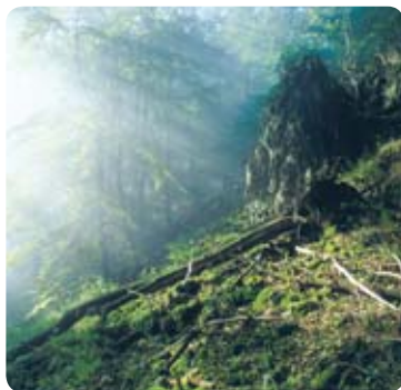
Pralesovitý porost na Růžovském vrchu

Zdatnější jedinci mohou v těchto místech na chvíli opustit trasu naučné stezky a vystoupat na vrchol Růžovského vrchu, který je se svými 619 metry nejvyšším bodem národního parku. V minulosti zde stávala rozhledna, ze které se nabízel nádherný výhled do dalekého okolí. Údajně odtud bylo vidět až do Drážďan. Dnes je zde vztyčen dřevěný kříž a umístěna vrcholová knížka. Vyhlídka z vrcholu je však již pouze omezená.