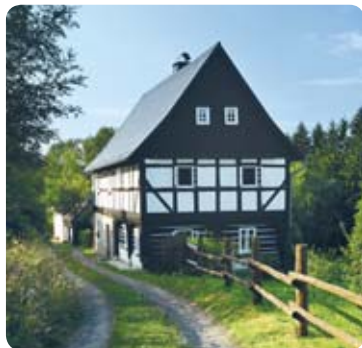
Hrázděný dům s podstávkou

Po krátké cestě lesem se před vámi objeví první roubené a hrázděné domky starobylé vesničky Kamenická Stráň. Ne náhodou se v roce 1995 stala vesnickou památkovou zónou. Zdejší zachovalé lidové architektuře je také věnována velká část textů sedmého zastavení. Jako by se zde před sto lety zastavil čas. Jenom cílý ruch na polích a v lesích a štěbetání dětí nahradil jakýsi smutek a zvláštní klid, tak typický pro všechny chalupářské oblasti.