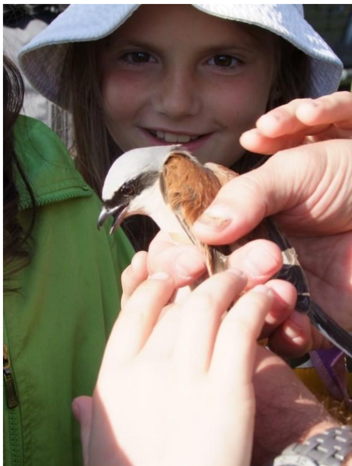
Vítání ptačího zpěvu (5.5.2012)