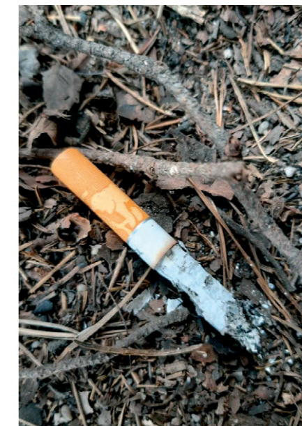
Nedopalek cigarety u stezky na Pravčickou bránu.