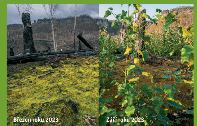
Březen roku 2023