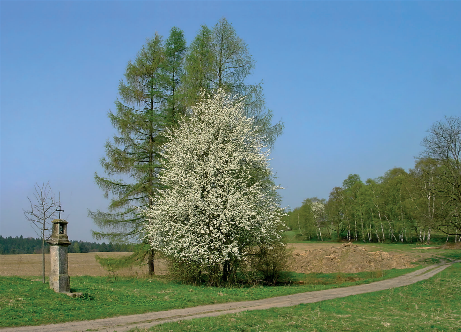
Planá hrušeň v Kamenické Stráni (NP České Švýcarsko). © Petr Bauer