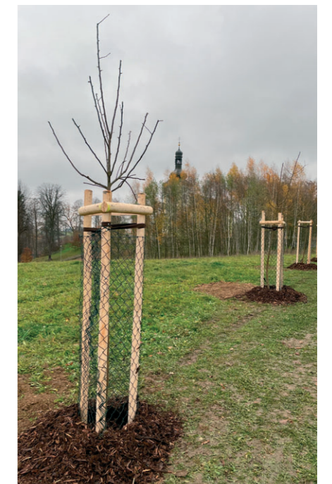
Výsadba ovocných dřevin v CHKO České středohoří (Markvartice). Podpořeno z prostředků MŽP a SFŽP.

Za Správu NP České Švýcarsko se ptal Ing. Petr Bauer.