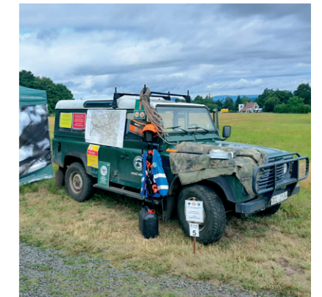
Stánek strážců NP na Světovém dni strážců na Panské skále.