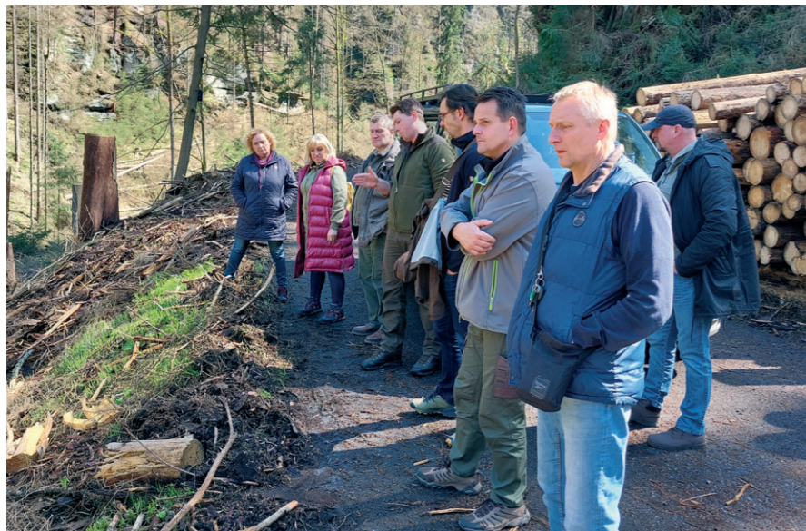
Prezentace bezpečnostního zásahu v Kyjovském údolí pro starosty z regionu národního parku.

Romantické Kyjovské údolí zná většina výletníků z našeho severu a je jistě nejnavštěvovanější turistickou trasou v severovýchodní části národního parku. V zalesněném a skalnatém údolí podél říčky Křinice bylo vždy příjemně v letních parnech, na podzim lákalo na klidnou procházku s výletem na skalní hrádky, a když napadl sníh, stálo za to se jít pokochat staletými smrků pokrytými čepicí čerstvého sněhu. A na jaře tu díky vysokým smrkům a skalním stěnám setrval sníh a led na cestě, když už jinde dávno byly cesty suché.