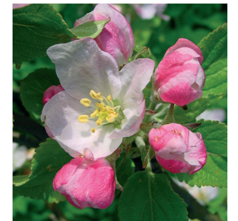
Květ jableň.