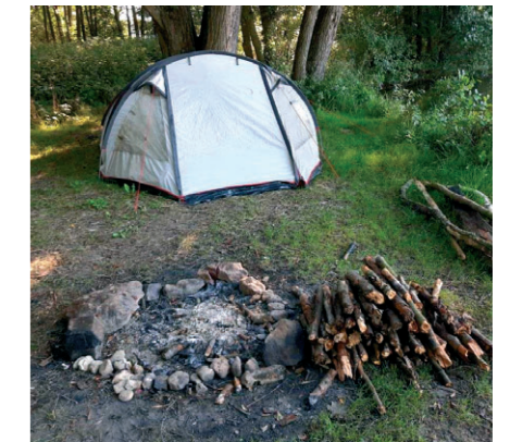
Porušení zákazu táboření a rozdělávání ohně.