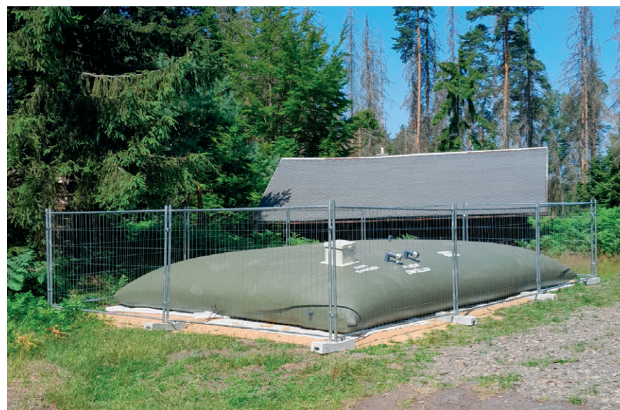
Velkoobjemové hasičské vaky vyvinuté na základě specifikace od hasičů děčínskou firmou Jabor pro, s. r. o. se nyní nacházejí na třech místech národního parku.