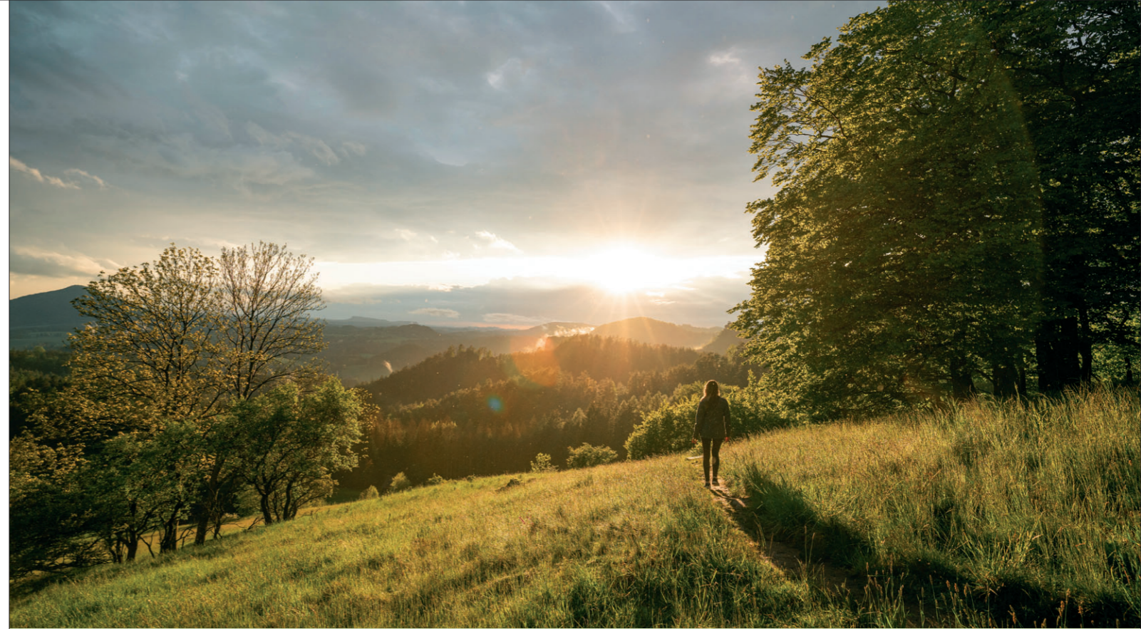
Křížový vrch v Rynarticích.