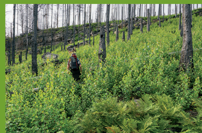
Spáleniště po požáru v srpnu 2022. U Větrného vrchu už bylo v září roku 2023 spáleniště zarostlé břízami i 1,5 metru vysokými.